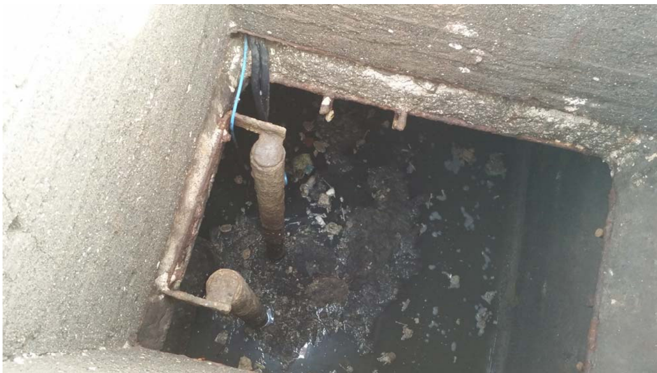
Fotografia 02 – Vasca alloggiamento elettropompe