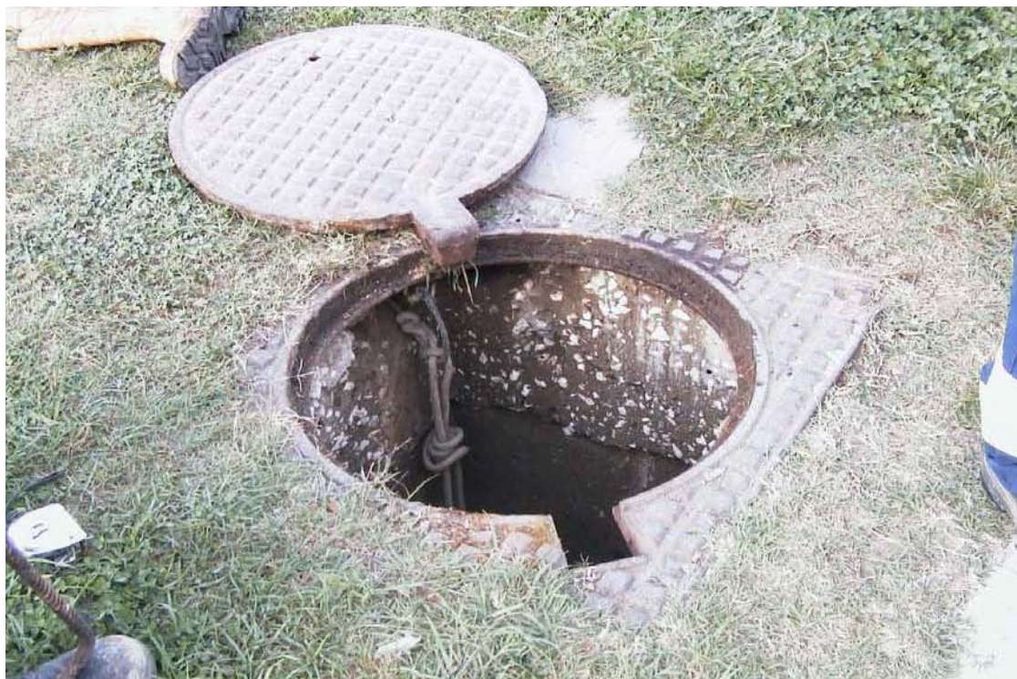
Fotografia 03 – Camera di manovra