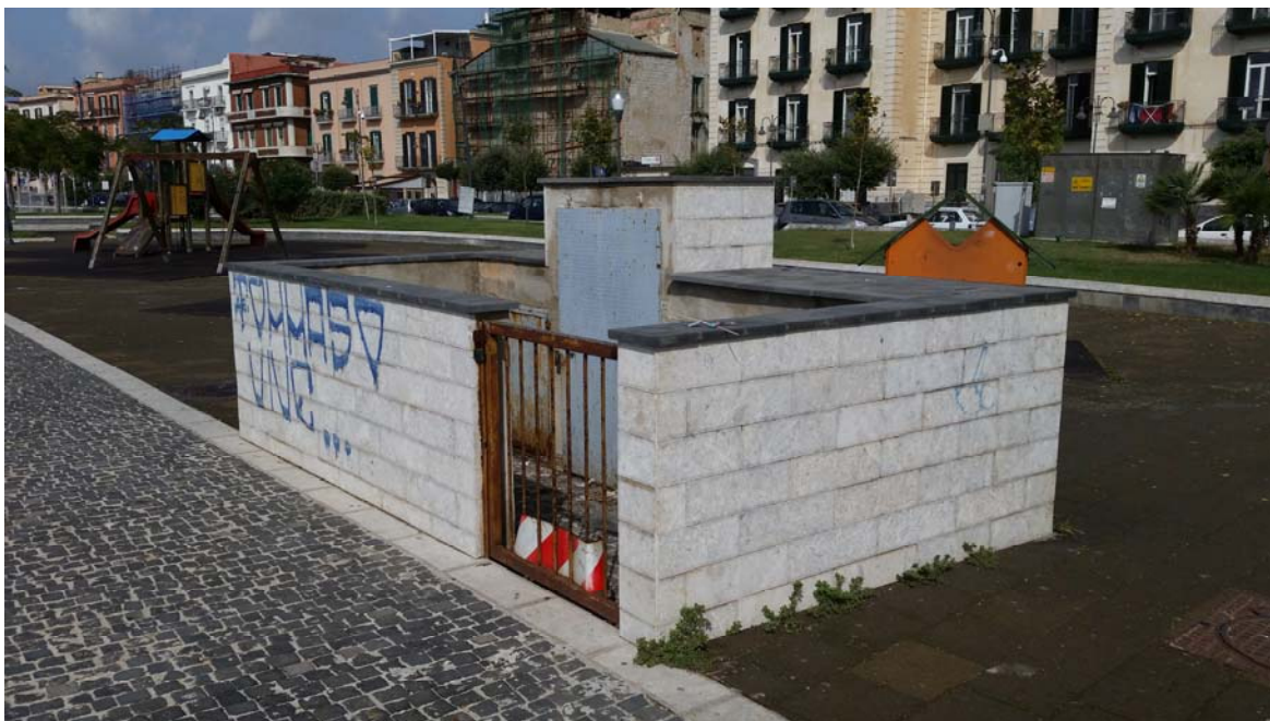
Fotografia 01 – Vista esterna

Nel presente paragrafo si riportano alcune fotografie relative all'impianto nei punti più significativi dell'impianto di sollevamento di Terme La Salute Via Napoli .